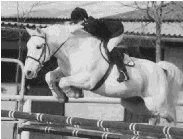
Hableur de Ravary.

Hableur de Ravary (Co) est un fils de Island Earl et de Raford Ladybird par Clonkeehan Auratum. Sept produits de cet étalon ont été présentés. Un lot homogène ayant laissé dans l'ensemble une impression de force à l'obstacle, un produit s'est détaché du lot (9) ; note minimum : 6,5 ; maximum : 9 ; moyenne pondérée : 7,43.