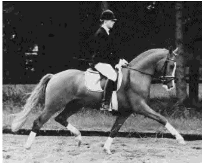
Top Nonstop fait partie des étalons étrangers pour lesquels l'AFPES a demandé l'agrément automatique en France.