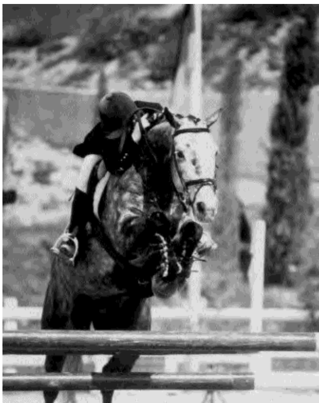
Le père du poney international Bacchus a un Blup insignifiant. C'est un Pur-sang qui a sailli la Connemara Vinca II, alors qu'il était yearling.

Le mode de calcul du BLUP, sur lequel il n'est pas question ici de s'étendre, en se basant grosso modo sur les gains obtenus en CSO par le cheval et sa famille, pénalise honteusement les reproducteurs de sang puisque les purs sangs , comme les arabes , n'ont pas pour vocation première d'être utilisés en CSO et ce sans pour autant que leur intérêt capital en tant que reproducteurs pour le CSO puisse être nié : ils sont à la base de l'équigénèse mondiale. Les anglo-arabes , issus d'un berceau de race où le testage en cycle classique et en compétition est traditionnellement moins systématique de la part des éleveurs locaux que ce qu'il peut être en terre normande, se retrouvent aussi souvent affublés de BLUP bas, ce qui pourtant ne prouve rien quant à leur intérêt génétique. En effet, " l'absence de preuve (de qualité) n'est pas une preuve (d'absence de qualité) ".