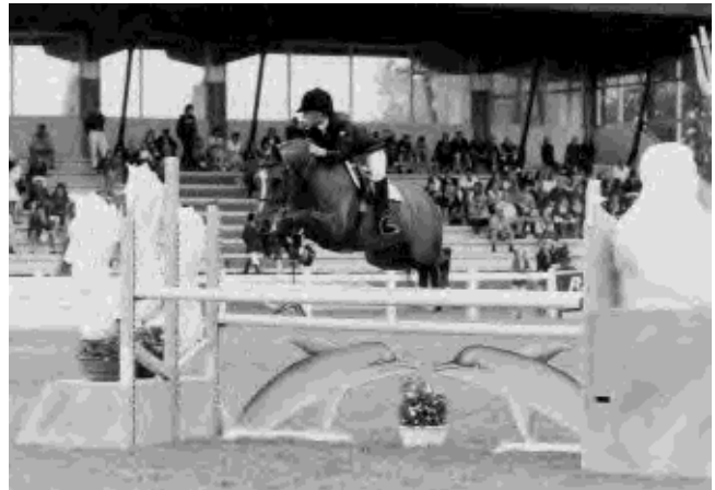
Queen, la championne d'Europe en titre, qui toise 1.41 m, doit compenser sa petite taille par une grande vitesse et énormément d'énergie.

Issu d'une famille méconnue du grand public, mais rigoureusement sélectionnée et de grande qualité, il produit beaucoup d'aptitude, de sang, de la solidité et un mental équilibré et ce, avec beaucoup de constance et