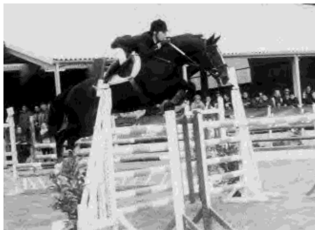
Riton de Courgeron