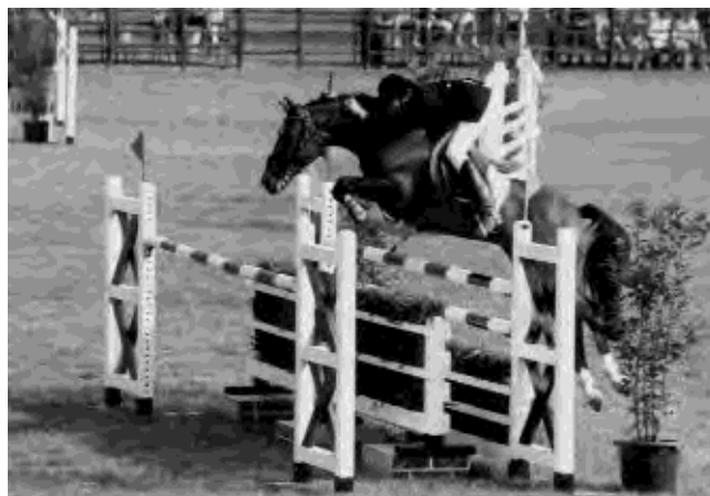
Shining Starr Aristo