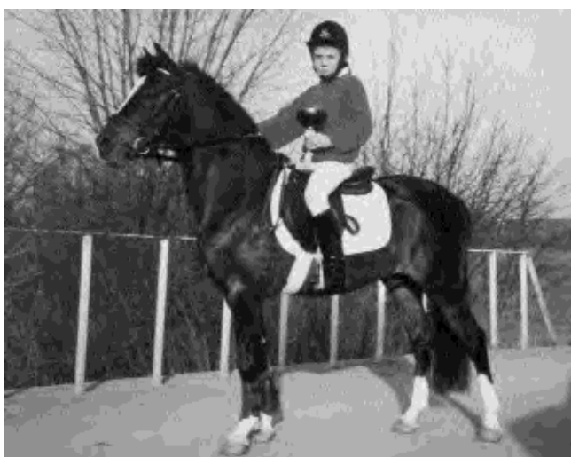
Le très beau petit étalon B Ten Ankers Bileander, excellent performer New-Forest hollandais, s'est fait remarquer par la qualité de sa production.