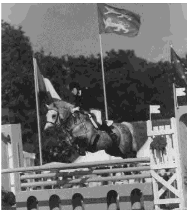
L'étalon Connemara Country Melody a fait le record des Achats des Haras Nationaux 1998 : il part pour 140 000 FF à La Roche sur Yon.