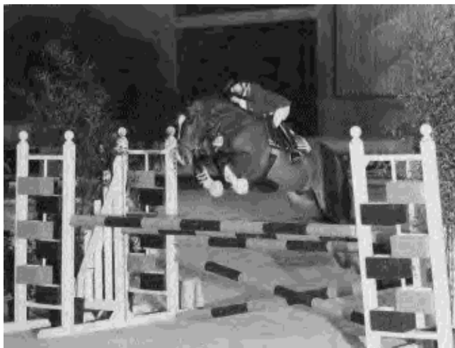
Contre toute attente, le jeune et prometteur Titanic des Bruyères, victime d'un iceberg d'incompréhension, de mauvais esprit et d'amateurisme, a coulé à pic à Lamotte-Beuvron.

La politique en faveur de la performance sportive menée par les dirigeants de l'élevage du poney de sport est pour le moins surprenante.