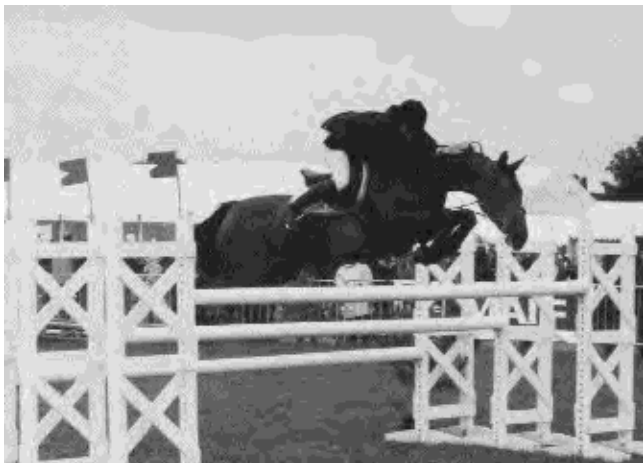
Lady Hollyhock, une des meilleures ponettes internationales d'Europe, est très imprégnée de Pur-sang comme beaucoup d'autres de ses congénaires.

Ces considérations sur la façon d'appréhender le BLUP, notamment quant au danger de l'éloignement au sang nous amènent aux lignes qui suivent. Puisqu'il est question de la nécessité absolue de la présence de sang dans le phénotype des poneys de haut niveau, il convient, je pense, de s'employer à tordre le coup à une rumeur qui court, d'ailleurs souvent reprise et amplifiée par les opposants aux croisements poneys - chevaux, à savoir qu'un poney faisant preuve de beaucoup de sang est ingérable par nos jeunes cavaliers. Cet argument fallacieux repose sur une confusion navrante entre le sang et la nervosité.