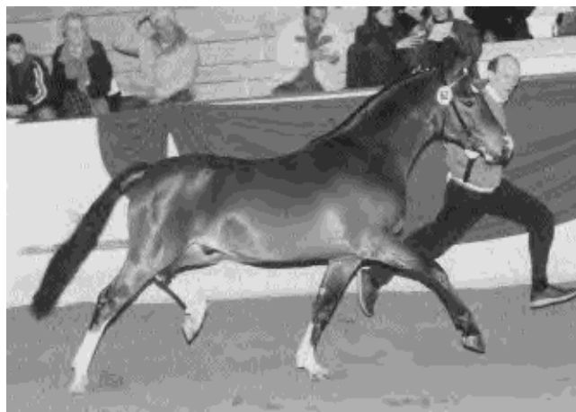
Le troisième classé... à vendre 135 000 FF !