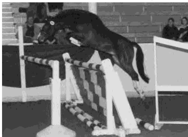
Le même à l'obstacle.

Possédant une bonne centaine de poneys dont une vingtaine d'étalons et une trentaine de poulinières, il fait faire sept heures de route à ses candidats de Berlin à Münster parce qu'il considère que " c'est le rassemblement qualitativement le plus important du pays et