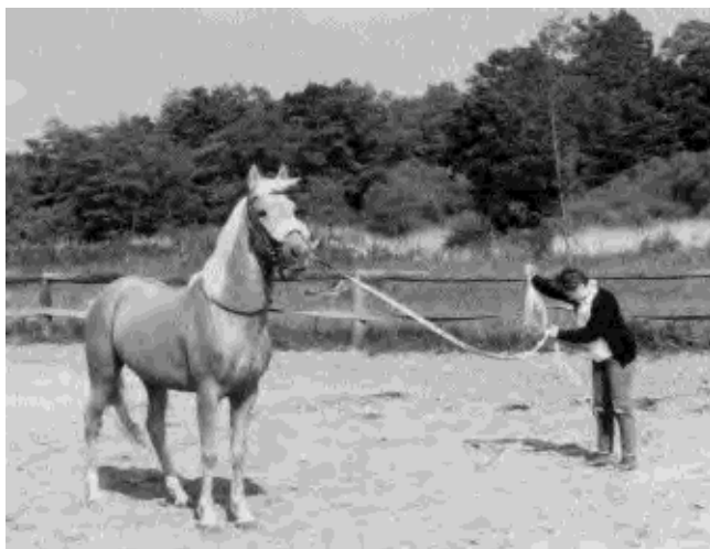
Tourbillon de Syl, au débouillage.

A quatre ans, il participe à son premier modèle et allures, aptitude selle et obstacle. Résultat : meilleure note à l'obstacle et 4ème de la finale toutes races confondues au Salon du cheval à Paris.