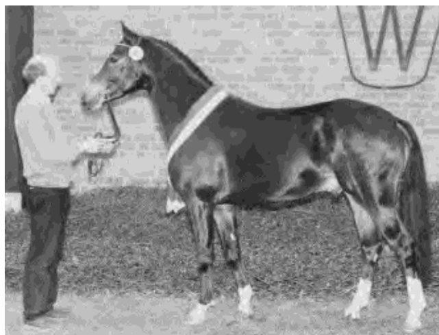
Le vainqueur des candidats étalons de 2 ans et demi.